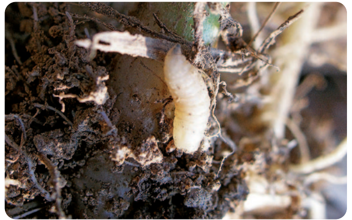
Larva květilky zelné - Delia radicum (velikost = 7–8 mm)