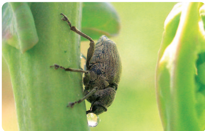
Dospělec krytonosce řepkového - Ceutorhynchus napi (velikost = 3–4 mm)