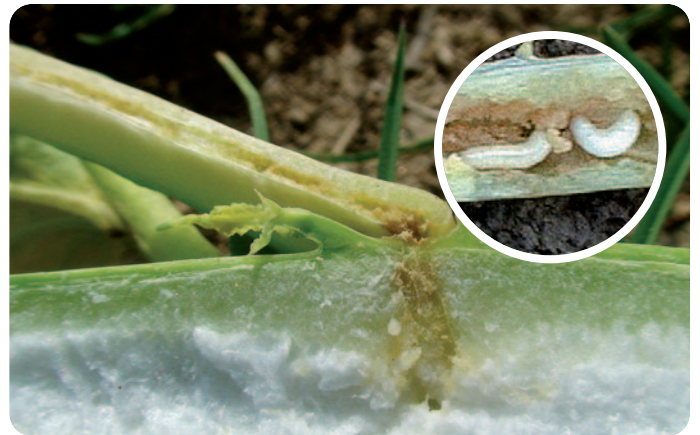
Poškození řapíku a stonku po žiru larev krytonosce čtyřzubého (velikost = 4–5 mm)