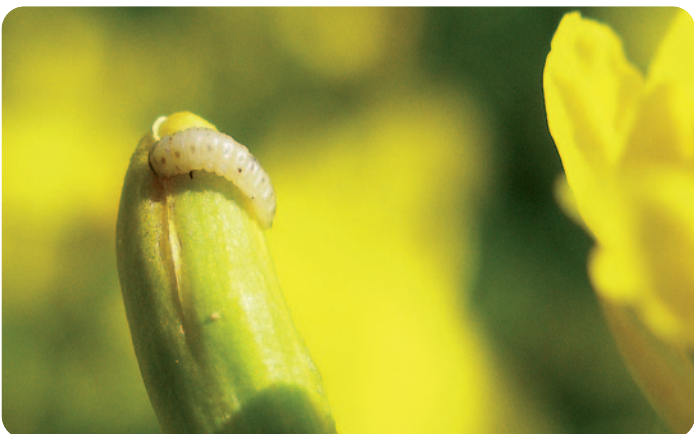
Larva blýskáčka řepkového - blýskáček řepkový - Meligethes aeneus