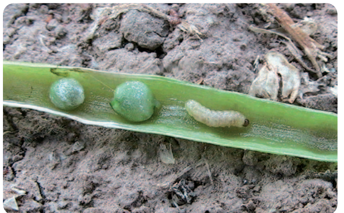
Larva krytonosce šesťúhlového - Ceutorhynchus obstructus (velikost = 3–4,5 mm)