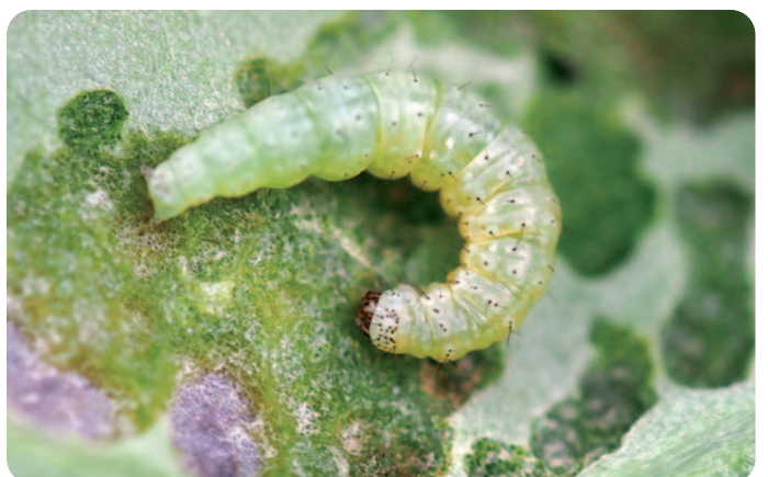
Housenka záředníčka polního - Plutella xylostella L. (velikost = 5–10 mm)