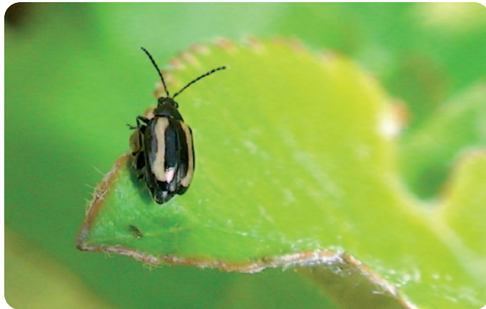
Dřepčci rodu Phyllotreta (velikost = 2–3 mm)