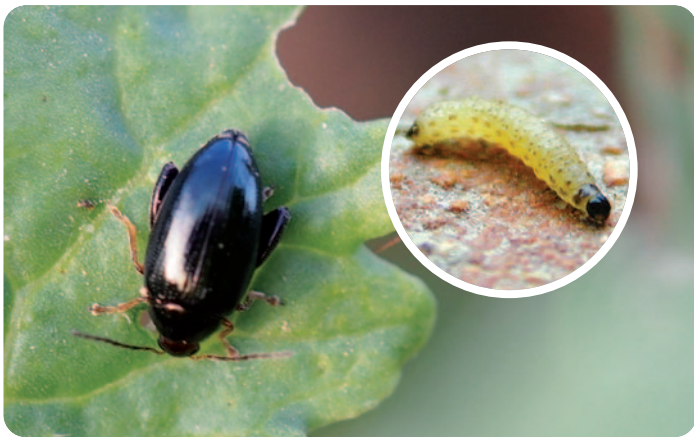
Dospělec (velikost = 3–4,5 mm) a larvičky (velikost = 6–8 mm) dřepčíka olejkového