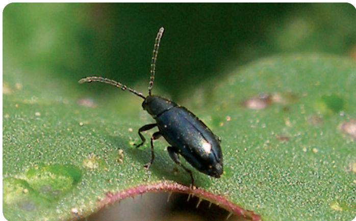
Dospělci dřepčků rodu Phyllotreta (velikost = 2–3 mm)