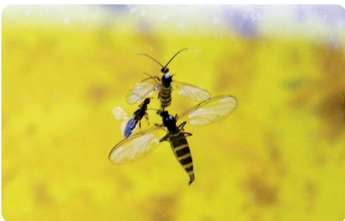
Bejломorka v Möriceho misce, vlevo menší je užitečný parazitoid