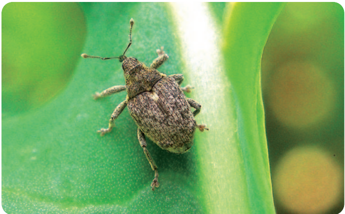
Dospělec krytonosce čtyřzubého - Ceutorhynchus pallidactylus (velikost = 2–3 mm)