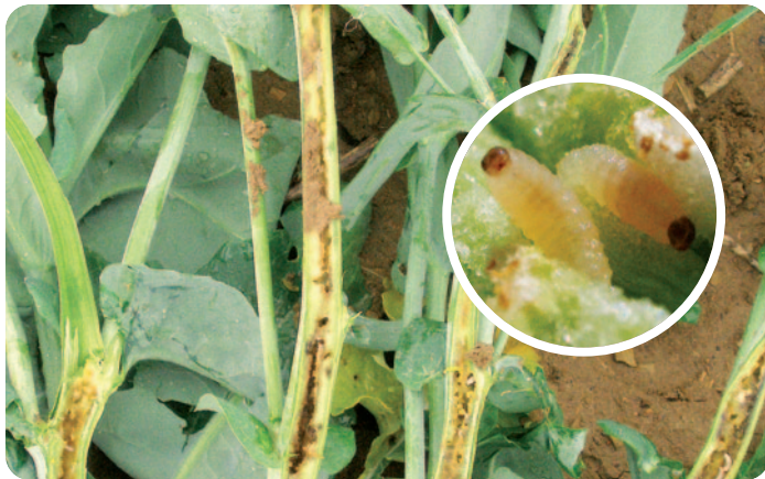
Larvy krytonosce řepkového ve stonku (velikost = 5 mm)