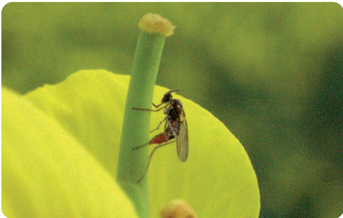
Dospělec bejломorky kapustové - Dasineura brassicae (velikost = 1,5 mm)