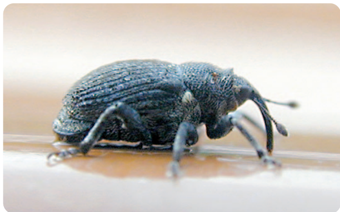
Dospělec krytonosce zelného - Ceutorhynchus pleurostigma (velikost = 2–3 mm)