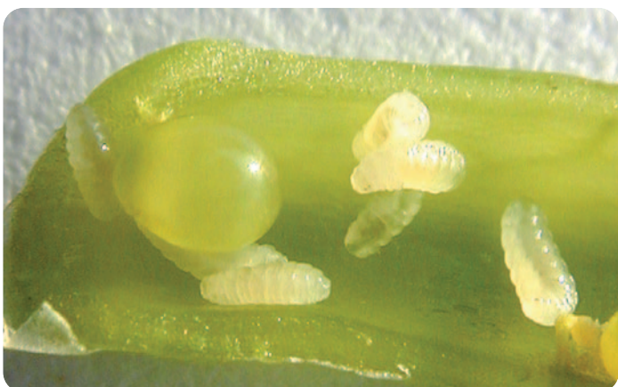
Larvičky bejlootky kapustové - Dasineura brassicae (velikost = 2–3 mm)