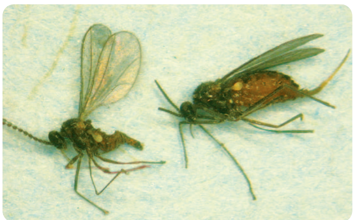
Vlevo samec, vpravo samička bejломorky kapustové - detail